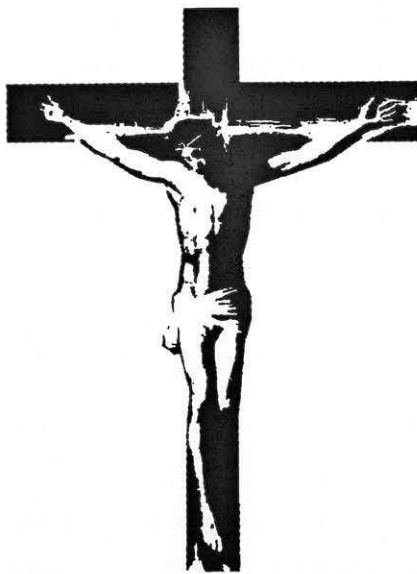
Jesus on Cross Stencil www.spraypaintstencils.com